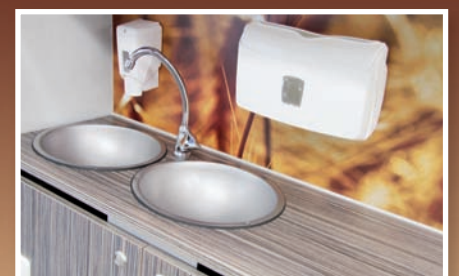
Hygienebereich mit Doppelwaschbecken