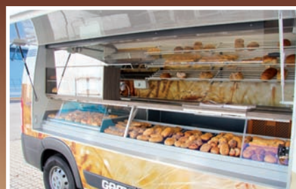
Verkaufstheke mit Hebeglasbeschlag