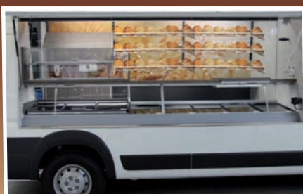
Innenraumansicht mit Frontzusatzbord