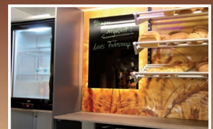
Rückraumansicht mit Kühlschrank