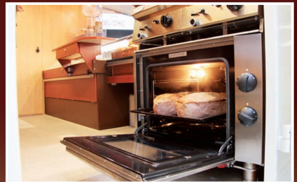
heller und geräumiger Innenraum

Diese GAMO-Neuheit ist Ihr idealer Partner im mobilen Frühstücksvorverkauf! Reichhaltig ausgestattet mit einem funktionellen und modernen Backwaren- und Snackinnenausbau lässt dieses Mobil keine Wünsche offen. Die helle und gut ausgeleuchtete Verkaufstheke, mit dem leicht zu reinigenden Hebeglasbeslag und der integrierten Kühltheke, bietet ausreichend Platz für Backwaren, Kuchen, Torten, Plunder und Snacks. Thekenseitig wurde für den berühmten „Coffee-to-go“ eine Kaffee-SB-Station installiert.