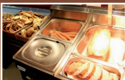
Snackeinheit mit Bain-Maries und Ofen