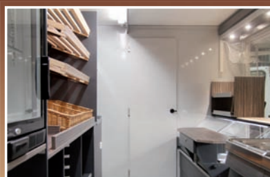
heller Innenraum mit Durchgangstür