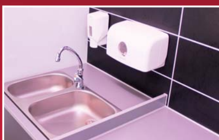
Hygieneeinheit mit Doppelpülbecken