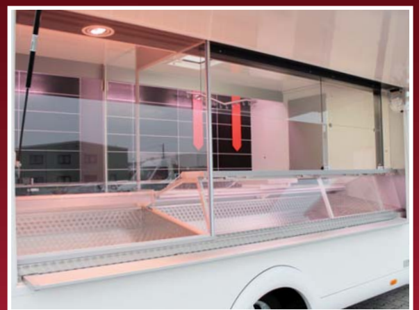
Thekenansicht mit Zweiraumaufteilung und Hebeglasbeschlag

Die leistungsstarke Kühltheke mit Zweiraumaufteilung ermöglicht es, neben klassischen Metzgereiprodukten wie Wurst und Fleischwaren, auch Hackfleisch, Molkereiprodukte oder gekühlte Spezialitäten anzubieten. Im Rahmen eines Touren-, Überland- oder Marktverkaufs kann der FRESH-MASTER SM 380 FF seine Stärken voll ausspielen. Dank der integrierten Unterthekenauszüge ist ausreichend Platz für Vorräte. Mit Hilfe von Schubladen werden dieses bequem unterhalb der Kühltheke in Normkisten verstaut.