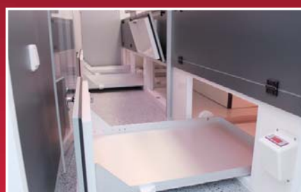
Unterthekenauszüge für gekühlte Vorräte