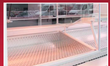
Edelstahl-Kühlthekenwanne - leicht zu reinigen