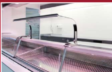
Kühltheke mit Radialhebeglasbeschlag