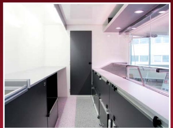
Innenansicht mit Fahrerhausdurchgang

Die leistungsstarke Kühltheke der FRESH-MASTER-Serie ermöglicht es, neben klassischen Metzgereiprodukten wie Wurst und Fleischwaren, auch problemlos Frischfleisch oder Molkereiprodukte wie Käse oder gekühlte Spezialitäten anzubieten. Im Rahmen eines Touren-, Überland- oder Marktverkaufs kann der FRESH-MASTER SM 380 KS seine Stärken ausspielen. Dank der integrierten Untertheckenschübe ist ausreichend Platz für Vorräte, die mit Hilfe von Normkisten bequem unterhalb der Kühltheke verstaut werden können.