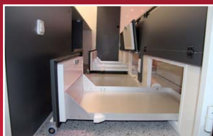
Untertheckenschübe für gekühlte Vorräte