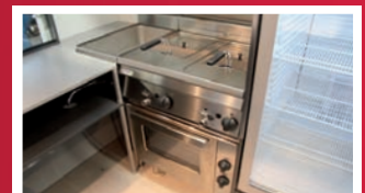
Abbildungen können vom Serienzustand abweichen