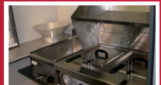
Abbildungen können vom Serienzustand abweichen