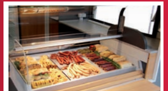
Abbildungen können vom Serienzustand abweichen