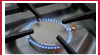
Abbildungen können vom Serienzustand abweichen