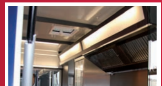
Abbildungen können vom Serienzustand abweichen