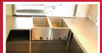
Abbildungen können vom Serienzustand abweichen